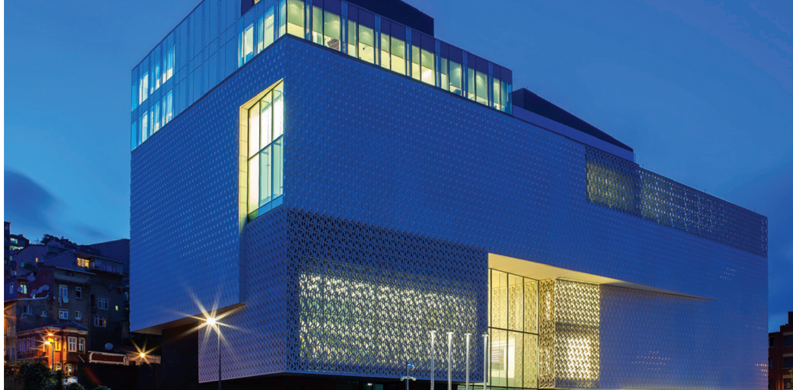
Arter; pandemiye etkileşime önem veren etkinliklerle ziyaretçisiyle buluşmaya devam etti.

Pandemi boyunca izleyicilerimizle ekranları başında kurduğumuz birlikteliği, kapılarımızı yeniden açtığımız döneme taşınan olumlu tezahürleri de oldu elbette. Artık erişilebilirliğin boyutları bizim için değişmişti; fiziksel olarak bir araya gelebildiklerimiz ve coğrafi sınır gözetmeksizin bulduğumuz izleyicilerimizle çok sesliliğimizi sadece programımızda değil, dijital mecralar üzerinden de yaşattık ve yaşatmaya da devam ediyoruz. Hâlen sürdürdüğümüz çevrim içi rehberli turlarımız üzerinden İstanbul’a uzak coğrafyadan katılımcılarla bir araya gelmeye devam ediyoruz farklı bir kazanım oldu bizler için.